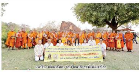
มหาวิทยาลัยอัสสัมชัญ มหาวิทยาลัยอัสสัมชัญแห่งประเทศไทย