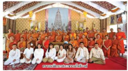
คณะนักบวชพระสงฆ์ไทยที่อินเดีย