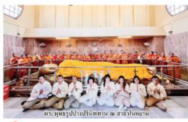
พระภิกษุสงฆ์ปฏิบัติศาสนกิจ ณ วัดอัสสัมชัญ