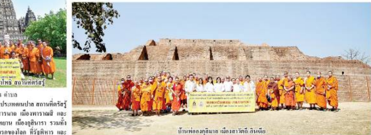
บ้านทุ่งอัญญาเขต เมืองลาวพวน ดินแดน

ณ ดินแดนพุทธภูมิต้นกำเนิดพระพุทธศาสนา 4 ตำบล สถานที่ประดิษฐาน รูปเหมือนพระ ปฐมพุทธเจ้า สถานที่ประดิษฐานพระพุทธรูปปางปฐมเทศนา และสถานที่ประดิษฐานพระพุทธรูปปางนาคปรก ณ สวนหลวงเมืองพญา และสถานที่ประดิษฐานพระพุทธรูปปางนาคปรก ณ สวนหลวงเมืองพญา รวมทั้งมหาวิทยาลัยมหาจุฬาลงกรณราชวิทยาลัย วิทยาเขตมหานครราชบุรี และบัณฑิตวิทยาลัย มหาวิทยาลัยราชภัฏสวนสุนันทา