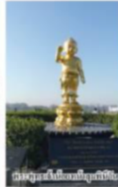
พระพุทธรูปปางนาคปรก