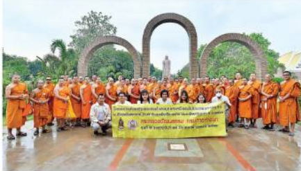
สงฆ์กับคณะ ที่วัดโยนนาหาร