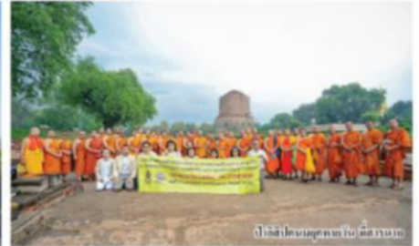
ปฏิบัติธรรมพุทธบริษัทที่เนปาล