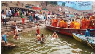
ชาวเมืองวางศพลงในแม่น้ำคงคา

แม่น้ำคงคา ที่มีพระพุทธรูป มีที่นำ หรือ "แกต" (Ghat) อยู่ 84 ท่า มีทั้งทศมาศ เป็นที่ศักดิ์สิทธิ์และใหญ่ที่สุด คำว่า "ทศมาศ" แปลว่า การวางดวงแก้วมีห้าสี อีกท่าสำคัญคือ ท่าแห่งทศกัณฐ์ มนต์กรรมกรรณญ์ ชาวฮินดูเชื่อว่าการนำศพมาที่นี่จะช่วยให้ดวงวิญญาณได้ไปสู่อารยสวรรค์ ฮินดูมีศก 5 ซักขาคือ นักรบ, หมอ, ช่างเหล็ก, เด็ก, ตกถูกเหล็ก และคนที่ถูกไฟเผาไหม้ได้เผาแล้วนำศพไปลอย เมื่อมาถึงท่าทศมาศ ที่เรียกว่า "ตึงศวรรค์" ที่มีพระอาราม บ้านเรือน ผู้คนอาศัยอยู่ แต่เช้าตรู่ เวลาตี 5 ท่ามกลางผู้คนฮินดูไป