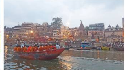
คณะกรรมการศาสนาเมืองเนปาล

แม่น้ำคงคา ที่มีพระพุทธรูป มีที่นำ หรือ "แกต" (Ghat) อยู่ 84 ท่า มีทั้งทศมาศ เป็นที่ศักดิ์สิทธิ์และใหญ่ที่สุด คำว่า "ทศมาศ" แปลว่า การวางดวงแก้วมีห้าสี อีกท่าสำคัญคือ ท่าแห่งทศกัณฐ์ มนต์กรรมกรรณญ์ ชาวฮินดูเชื่อว่าการนำศพมาที่นี่จะช่วยให้ดวงวิญญาณได้ไปสู่อารยสวรรค์ ฮินดูมีศก 5 ซักขาคือ นักรบ, หมอ, ช่างเหล็ก, เด็ก, ตกถูกเหล็ก และคนที่ถูกไฟเผาไหม้ได้เผาแล้วนำศพไปลอย เมื่อมาถึงท่าทศมาศ ที่เรียกว่า "ตึงศวรรค์" ที่มีพระอาราม บ้านเรือน ผู้คนอาศัยอยู่ แต่เช้าตรู่ เวลาตี 5 ท่ามกลางผู้คนฮินดูไป