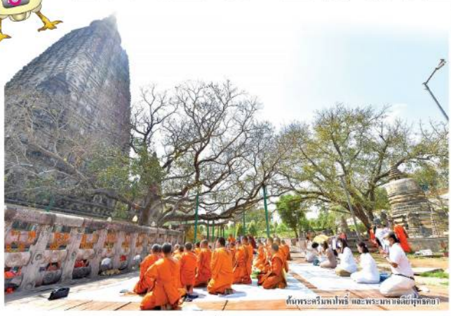
ต้นพระศรีมหาโพธิ์ และพระมหาเจดีย์พุทธคยา

รอยต่อที่ประดิษฐาน ณ เมืองพุมปี ประเทศเนปาล สถานที่ ศรัทธา ณ เมืองลดา อินเดียน สถานที่แสดงปฐมเทศนา ณ สารนาถ เมืองทวารวดี อินเดีย และสถานที่ประดิษฐานพระปริวิตพทาน ณ เมืองกุสินารา อินเดีย