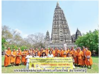
บมช. มหามกุฏราชวิทยาลัย มหาวิทยาลัยราชภัฏสวนสุนันทา

ณ ดินแดนพุทธภูมิต้นกำเนิดพระพุทธศาสนา 4 ตำบล สถานที่ประดิษฐาน รูปเหมือนพระ ปฐมพุทธเจ้า สถานที่ประดิษฐานพระพุทธรูปปางปฐมเทศนา และสถานที่ประดิษฐานพระพุทธรูปปางนาคปรก ณ สวนหลวงเมืองพญา และสถานที่ประดิษฐานพระพุทธรูปปางนาคปรก ณ สวนหลวงเมืองพญา รวมทั้งมหาวิทยาลัยมหาจุฬาลงกรณราชวิทยาลัย วิทยาเขตมหานครราชบุรี และบัณฑิตวิทยาลัย มหาวิทยาลัยราชภัฏสวนสุนันทา