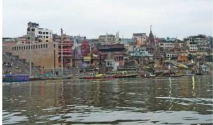
วันไหลทศที่เมืองกัตการมาญ