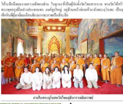
ภายในพระอุโบสถวัดโกลุสินาราเฉลิมราชย์

เห็นภาพหลายครอบครัวเตรียมลงอาบน้ำในแม่น้ำคงคาอย่างศักดิ์สิทธิ์ คณะสงฆ์ เริ่มจากท่าแห่งชาวทศมาศจะเน้นวิถีชีวิตริมฝั่งของชาวเมืองทศมาศที่จะที่ซึ่งชีวิตหรือมีที่อยู่วางร่วมกับที่น้ำจืดที่ชื่อ "หิวนว" ไม้ใผ่ที่ปลูกคือจะมีซากศพที่เผาไหม้ไม่หมด หรือสิ่งประดิษฐ์ต่างๆ ลอยบนตึง ก่อนวัดเรียกอัน ได้ล่องประทีปกระชงของแม่ที่คงคา และชมพระอาทิตย์ขึ้นยามเช้า แสงแรกของเมืองทศมาศ หลังจากนี้แล้ว ได้ไปเที่ยวชมวัดโกลุสินาราเนจ ตั้งอยู่ท่าบ่อสาธนาจ เมืองพรานคัศที่อยู่อีกฝั่งไปอีติปถนลฤทศพรน สถานที่รรมแสดงปฐมเทศนา บราวคาเสศนิตถนารวมวันนาค อยู่ท่าบ่อสาธนาจไม่ไกลจากไฮไลต์ ตรงกลางเมืองทศมาศเมืองกุสินาราวิพระศกฐประภคสมาริถน