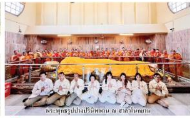
พระพุทธรูปปางบริพัตรพญานาค ๗ องค์ในสยาม