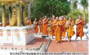
พระพุทธรูปทองคำ ณ เมืองลดา ประเทศเนปาล

ได้เดินทางมาในสภาพที่กว้างขวาง ได้เดินทางไปชมวัดวาสุธาราม ณ เมืองลดา