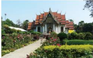
พระอุโบสถ วัดพุทธคุณาราม

วัดนี้เริ่มก่อสร้างเมื่อปีพ.ศ.2537 กษัตริย์พระอุบลราชธานีกรมการฝ่ายนี้เองพระราชทานที่ดินและพระพุทธรูปมาจัดตั้งอยู่ด้านหน้าทางเข้าพระอุบลราชธานี เดินทางอีกกว่า 200 กิโลเมตร ก่อนถึงเมืองสาธาณี ขึ้นประเทศไปเนปาล ที่บริเวณชายแดน เป็นที่ประดิษฐานพระพุทธรูป ๑๖๐ โดยพระคุณ สมเด็จพระมหารัชมังคลาจารย์ (หลวงปู่ทวด)