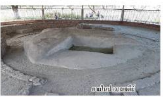
ภาพไปมาของเจดีย์