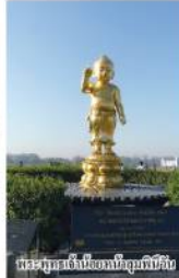
พระพุทธรูปทองคำที่วัดอรุณราชวราราม