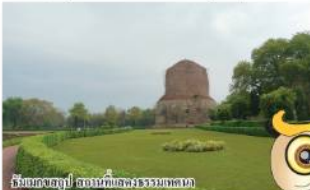
หินทรายโบราณ วัดอรุณราชวราราม