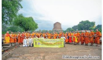
พิธีปลุกเสกพระพุทธรูปทองคำ