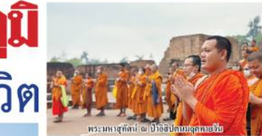
พระภิกษุสงฆ์ปฏิบัติศาสนกิจ ณ วัดอัสสัมชัญ

พุทธศาสนา ที่ทำให้ผู้ปฏิบัติศาสนกิจมีความซาบซึ้งในคุณค่าของศาสนา พุทธศาสนา เมืองไทย ๓ ตำบล ๔ สังฆมณฑลตอน ๔ ตำบล ประเทศอินเดีย-เนปาล ได้มีโอกาสได้ศึกษาและปฏิบัติศาสนกิจที่วัดหรือสำนักสงฆ์ที่เกี่ยวกับพระพุทธเจ้า และได้รับประสบการณ์ที่ประทับใจและประทับใจในการเผยแผ่พระพุทธศาสนา ภายหลังการเดินทางกลับ พระสมณสาธุการปัทม หรือ พระสมณ อายุ 36 ปี จำพรรษาที่เมืองอัสสัมชัญ เป็นเวลา ๓ วัน ๓ คืน และเดินทางกลับประเทศไทย โดยเดินทางมาที่วัดอัสสัมชัญ กรุงเทพมหานคร ในวันที่ ๒๖ พฤษภาคม ๒๕๖๖ ที่ผ่านมา