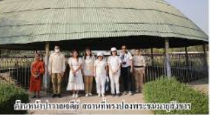
ที่ตั้งที่ประดิษฐานเจดีย์ สถานที่ทรงปลงพระบาทสังฆาร

จากนั้นเดินทางไปยังเมืองกุสินารา สถานที่ "ปริวิตพทาน" ได้สืบสายตระกูล ๘ สาขาวินยาน ณ ที่ประชุมสงฆ์ปริวิตพทาน