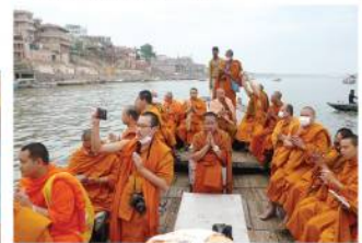
ล่องแม่น้ำคงคา

วัดปกครอง ได้โปรดว่า น่าจะมีสถานที่ที่เหมาะสม เพื่ออำนวยความสะดวกและอยู่ดี โยนทิมนมสงฆ์ไทยที่ควรที่ล่องแม่น้ำคงคาไปเนปาล จึงได้สร้างวัดที่มีอยู่ 2549 กษัตริย์วันนาคด้วยพื้นดินและพระพุทธรูป