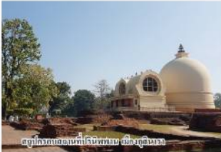
สตูปุที่วัดอรุณราชวราราม กรุงเทพมหานคร

วัดอรุณราชวราราม 4 ตำบล ขององค์พระสัมมาสัมพุทธเจ้า เป็นอนุสรณ์สถานที่ทำให้ระลึกถึงพระราชาประวัตินามของพระพุทธเจ้า ในแต่ละปีพุทธศาสนิกชนจากทั่วโลกเดินทางมาสัมผัสความศักดิ์สิทธิ์ที่องค์พระสัมมาสัมพุทธเจ้า พระพุทธชินราช (พ.ศ. ๒๕๖๖) โดยกรมการศาสนา ได้ควบคุมดูแลรักษา ในวาระที่องค์พระชินราช องค์ "โครงการส่งเสริมพระสงฆ์และพุทธศาสนิกชนไปประกอบศาสนกิจ ณ สังฆมณฑลอินท-เนปาล"