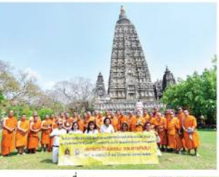
คณะพุทธคยา ๘ พระมหาเจดีย์พุทธคยา

พลาดเจดีย์ สถานที่ทรงปลงพระบาทสังฆาร ในวันเพ็ญเดือนอาสาฬหบูชา