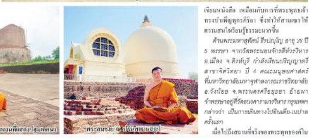
พระสมณสาธุการปัทม (สุภาพบุรุษ)