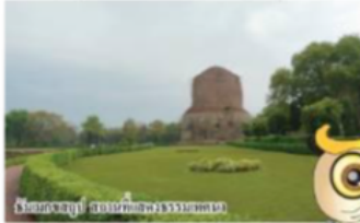
โบสถ์วัดสุทัศน์ กรุงเทพมหานคร

รองอธิบดีประทีป ณ เมืองสุรินทร์ ประกอบด้วย สถานที่สำคัญ ๗ เมืองสำคัญ ได้แก่ สถานที่แสดงปฐมเทศนา ณ สารนาถ เมืองพาราณสี อินเดีย และสถานที่ตั้งสังฆราชวิทยาลัยพาราณสี เมืองกัปิลวาปี อินเดีย