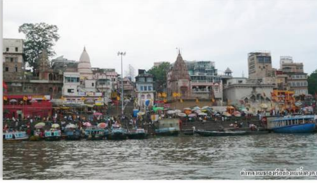
ท่าคลองมอญหรือเมืองแม่น้ำคงคา

ไฮไลต์ คือ การล่องเรือในแม่น้ำคงคาอันศักดิ์สิทธิ์ ที่ไล่ลงไปยังทั่วโลก และชมวิถีชีวิตชาวฮินดู ชาวฮินดูมีความเชื่อว่า แม่น้ำคงคา มีความยาวกว่า 2,525 กิโลเมตร เติมน้ำศักดิ์สิทธิ์ มีกลิ่นและได้ชื่อเพราะจันทร์ ๓๑ อยู่ที่นี่ พระนรกอยู่พระคิเว นอกจากสถานที่นี้จะไหลมาเจอภูเขาไฟกลายเป็นน้ำร้อนร้อนไปก็เกิดโรค ซึ่งต่างจากแม่น้ำทั่วไป จึงเชื่อว่าแม่น้ำในไถอุทวารที่ ล้างบาป อายคน บูชากราบไหว้ด้วยความนับถือ