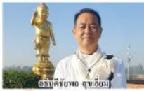
อริย์ปัทม (สุภาพบุรุษ)

ก รัตนาเป็น โครงการส่งเสริมพระสงฆ์และ พุทธศาสนิกชนไปประกอบศาสนกิจ ณ สังฆมณฑลตอน 4 ตำบล ประเทศอินเดีย- เนปาล ปี 2566 ของกรมศาสนา กระทรวงวัฒนธรรม (วธ.) ภายใต้กองทุนส่งเสริมการเผยแผ่พระพุทธศาสนาเฉลิมพระเกียรติ 80 พรรษา โดยนำพระสงฆ์จำนวน 42 รูป และพุทธศาสนิกชนที่ทำงานประจำไปปฏิบัติศาสนกิจที่วัดหรือสำนักสงฆ์จำนวน 18 แห่ง เดินทางไปศึกษาปฏิบัติศาสนกิจที่วัดหรือสำนักสงฆ์ที่เกี่ยวกับพระพุทธเจ้า