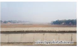
เมืองลดา ประเทศอินเดีย

วันรุ่งขึ้นขึ้นรถโดยสารไปประเทศเนปาล โดยทุกคันต้องจอดที่ท่ารถโดยสารที่เมืองลดา ประเทศเนปาล ในเขตเมืองลดา ประเทศเนปาล แล้วเดินทางไปสู่เมืองลดา ประเทศเนปาล แล้วเดินทางไปสู่เมืองลดา ประเทศเนปาล