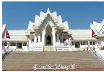
อุโบสถวัดพุทธวิเศษเมืองกุญทิณีโย