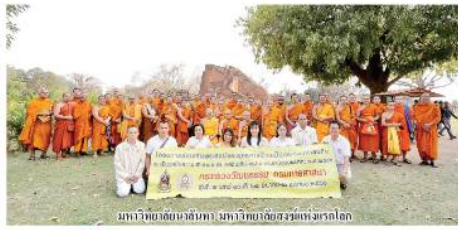
มาหาวิทยาลัยมหานิกาย มหาวิทยาลัยธรรมศาสตร์โลก