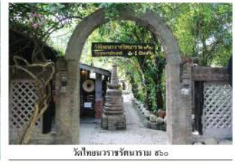
วัดโยนนาหารวัดนครน ๕๖๐