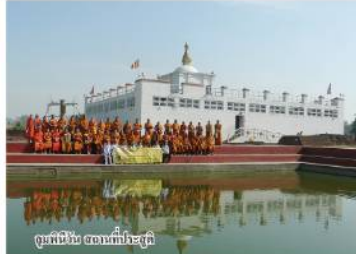
พุทธนิพนธ์ สถานที่ประดิษฐาน