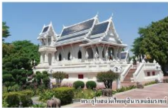
พระอุโบสถ วัดพุทธคุณารามเมืองนครฯ