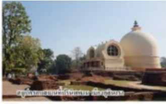
สถูปขาวเมืองอินทนิคม จังหวัดอุบลราชธานี