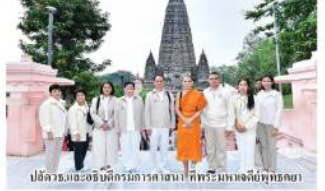
ปัสตอร์และอธิบดีกรมการศาสนา ที่พระมหาเจดีย์พุทธคยา