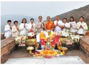
พระสังฆราชเจ้าคณะภาค ๑๑ กรุงเทพมหานคร