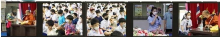
กิจกรรม "แสงแห่ง ปัญญา"