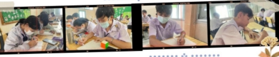
กิจกรรม "มองในสิ่งที่มิ ไม่ใช่สิ่งที่ขาด"